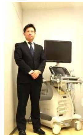
肝臓の硬さを計測出来る 超音波診断装置（エコー）